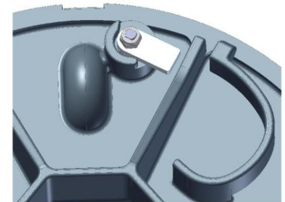
Detail obtlíkové uzamykací sady (obi.č. 894 708 LOCK)