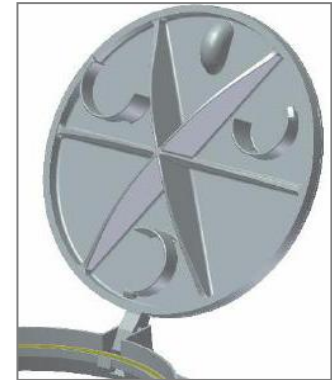
3násobná pružinová aretace víka